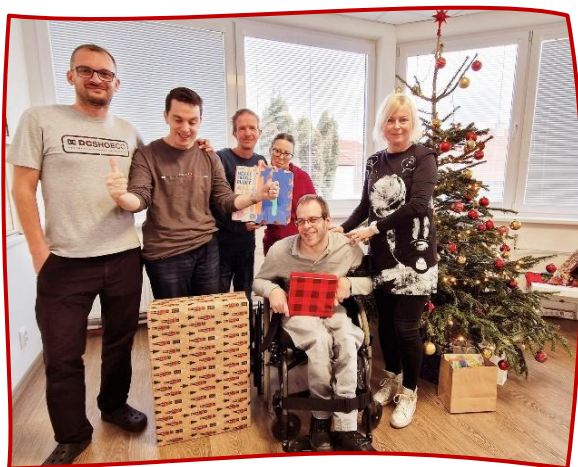
darčeky od p. župana Drobu a BSK

Autormi obrázka z titulnej strany sú Tomáš Gajdoš & Majka Šišláková.