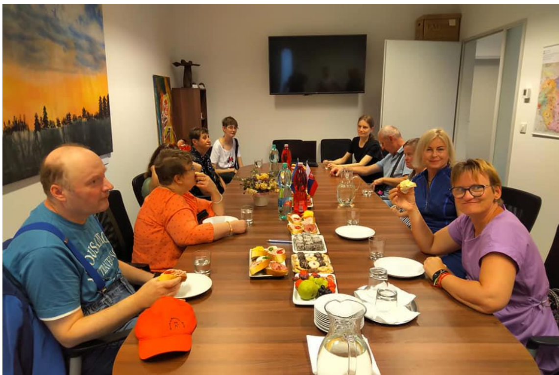
Deň otvorených dverí v CSS Javorinská