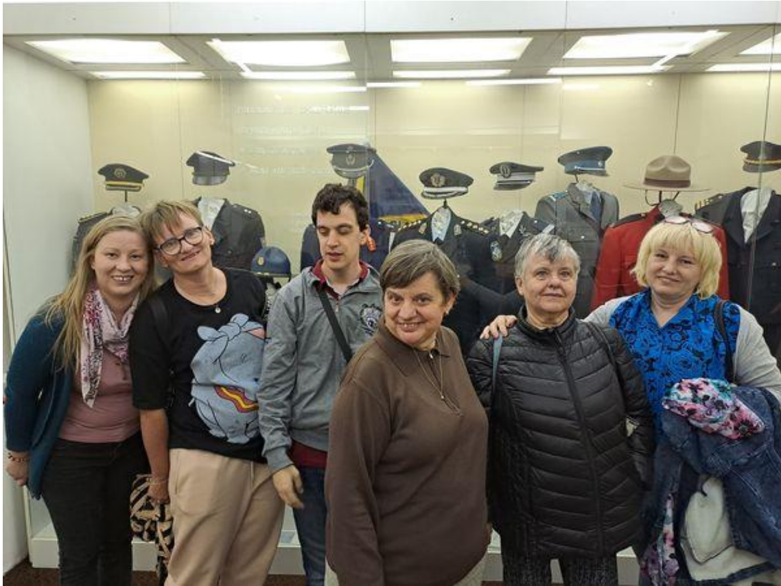
V Múzeu dopravy