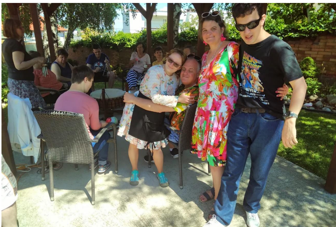
Župný guláš pre zariadenia sociálnych služieb v pôsobnosti BSK